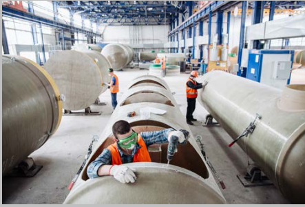
Производство г. Тольятти