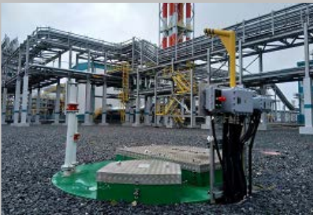
Производство и поставка 30-и комплектных КНС ПАО "СИБУР Холдинг" Западно- Сибирский Нефтехимический комбинат Г. Тобольск